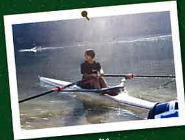
笠置ボートキャンプ地