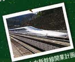
リニア中央新幹線開業計画